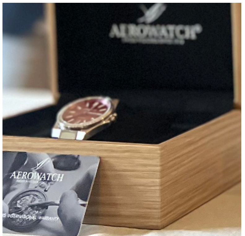
Der von Aerowatch gestiftete Sonderpreis

Artisans Vignerons d'Yvorne, Chablais AOC Chant des Resses Grand Cru, 2023